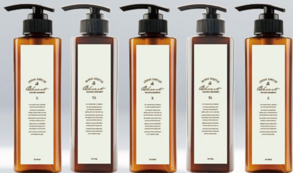
NATURAL SHAMPOO & TREATMENT